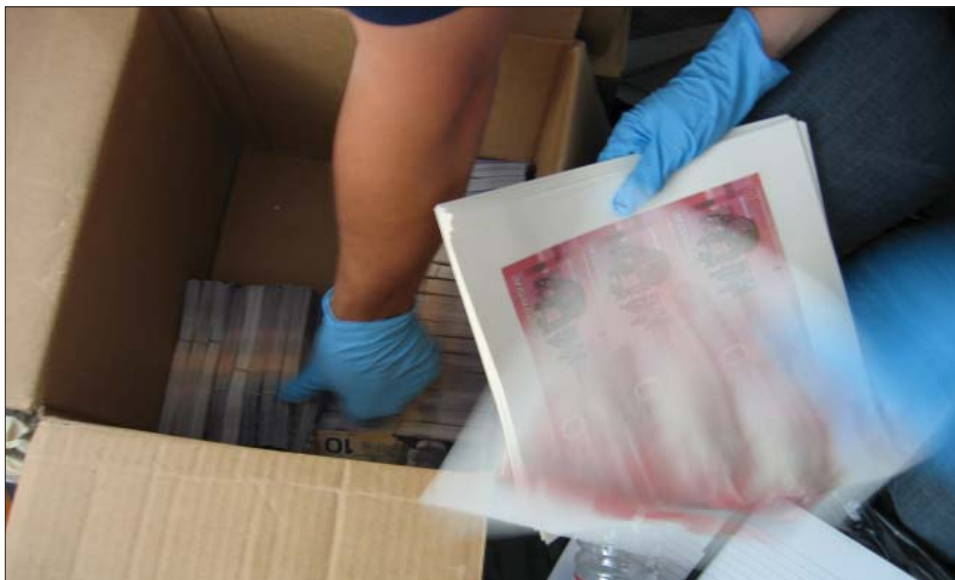
Project OPHIR I and II seizures